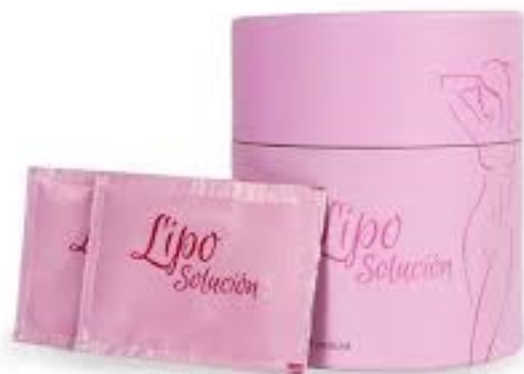
Fig.1: Imagen del producto LIPO SOLUCIÓN