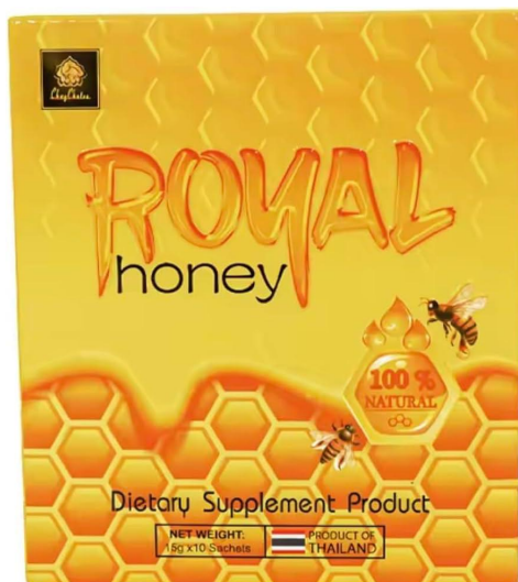
Fig.1: Imagen del producto ROYAL HONEY